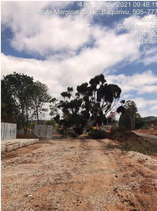
FOTO 6 - SUPRESSÃO VEGETAL