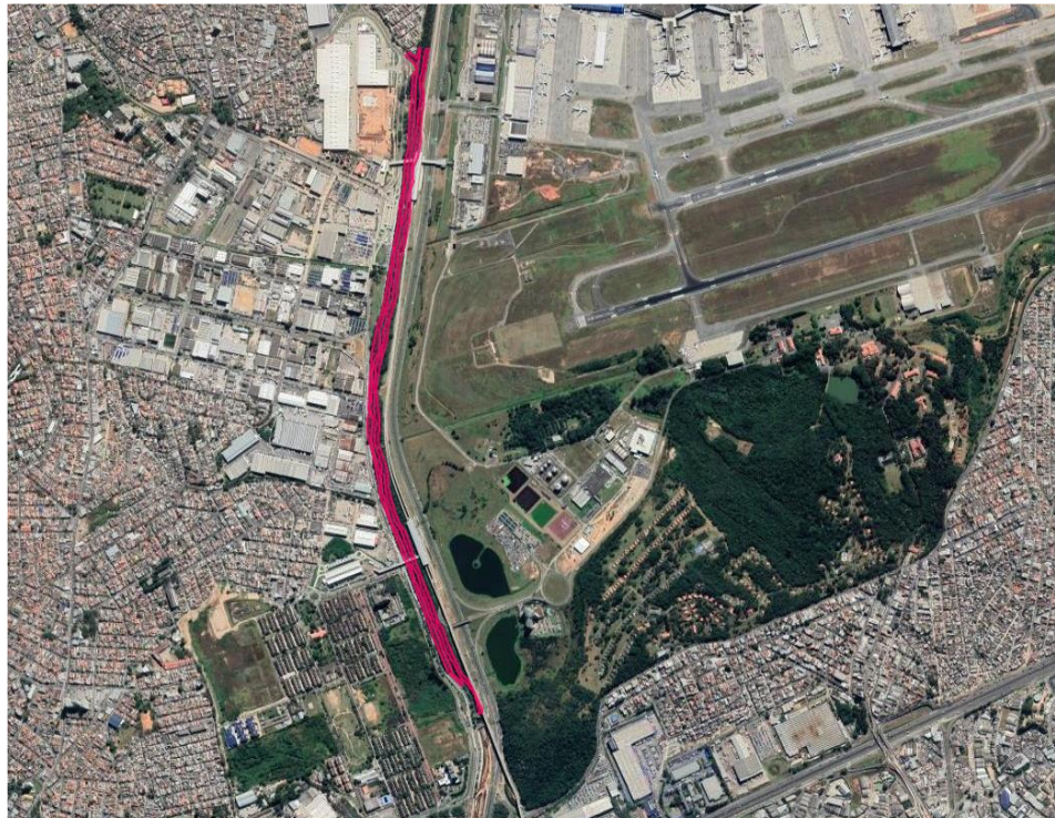
Figura 1 – Área do Projeto