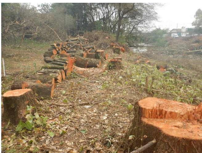
Foto 11: Armazenamento temporário do material lenhoso na porção central da margem esquerda do rio Baquirivu Guaçu (Autorização nº 31890/2021).