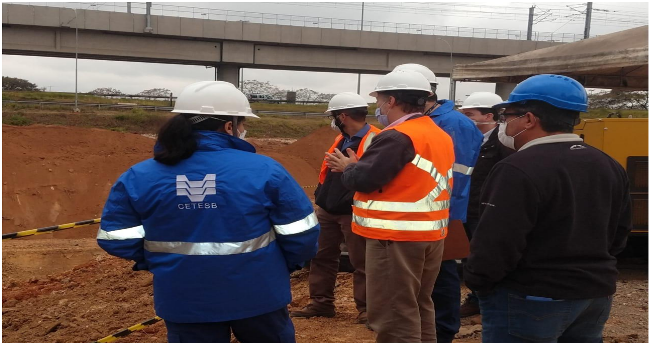
Foto 5: Vistoria CETESB, parcela 2A de supressão e Canteiro operacional