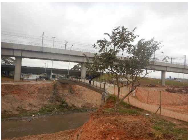
Foto 3: Passagem aérea existente sobre o rio Baquirivu Guaçu, próxima à estação Aeroporto-Guarulhos.