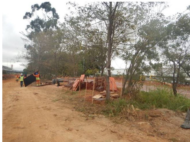
Foto 2: Área autorizada para implantação do canteiro de obras (Autorização nº 38393/2021).