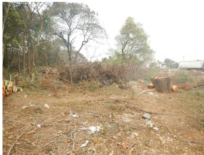
Foto 8: Área de supressão na porção central da margem esquerda do rio Baquirivu Guaçu (Autorização nº 31890/2021).