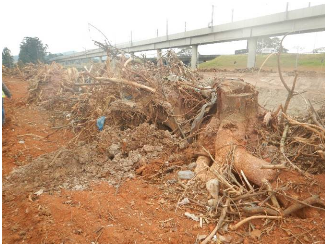
Foto 7: Deposição temporária do material oriundo da supressão de vegetação e limpeza do terreno na porção norte da margem direita do rio Baquirivu Guaçu (Autorização nº 31890/2021).