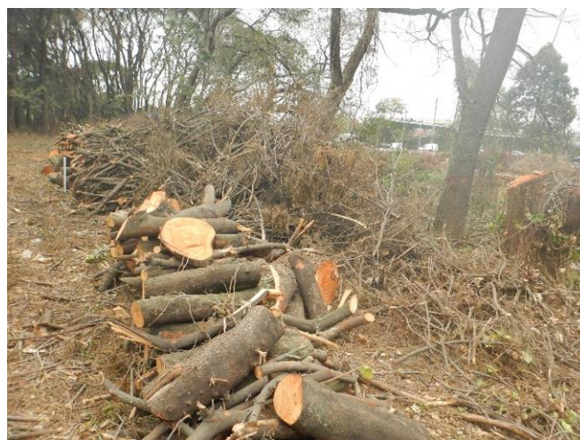
Foto 12: Armazenamento temporário do material lenhoso e galharia fina na porção central da margem esquerda do rio Baquirivu Guaçu (Autorização nº 31890/2021).