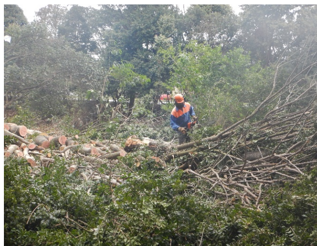
Foto 16: Supressão de vegetação na porção sul da margem esquerda do rio Baquirivu Guaçu (Autorização nº 31890/2021).