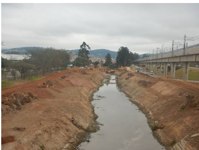
Foto 5: Margens do rio Baquirivu Guaçu - vista a jusante a partir da estação Aeroporto-Guarulhos.