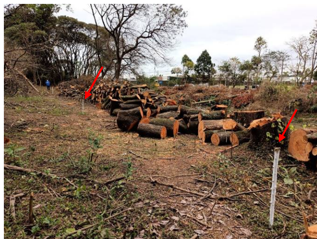
Foto 10: Limite da área de intervenção e armazenamento de material lenhoso na porção central da margem esquerda do rio Baquirivu Guaçu (Autorização nº 31890/2021).