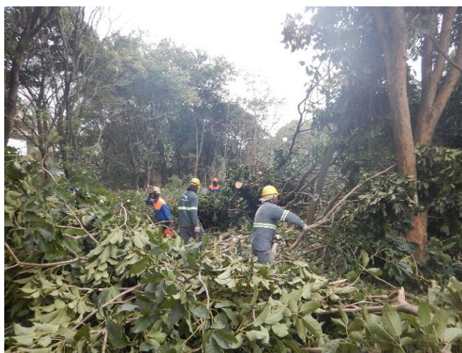
Foto 15: Supressão de vegetação na porção sul da margem esquerda do rio Baquirivu Guaçu (Autorização nº 31890/2021).