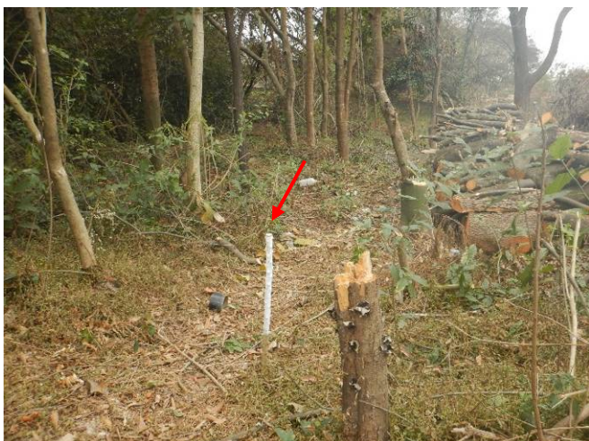
Foto 9: Limite da área de intervenção na porção central da margem esquerda do rio Baquirivu Guaçu (Autorização nº 31890/2021).