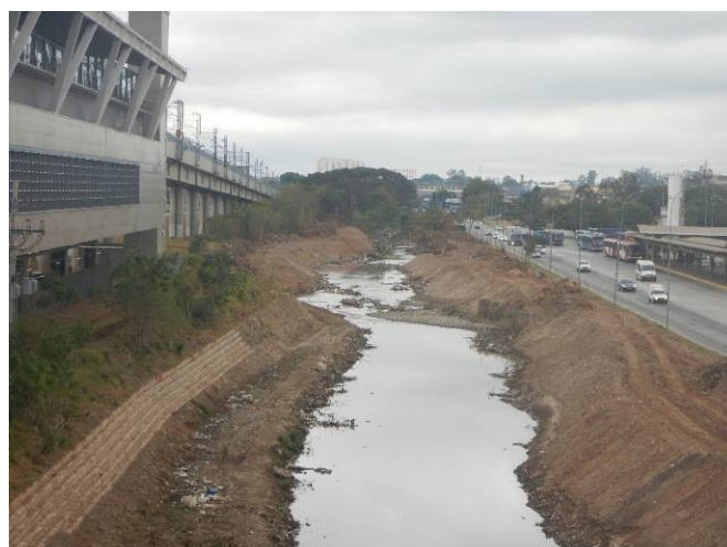
Foto 6: Margens do rio Baquirivu Guaçu - vista a montante a partir da estação Aeroporto-Guarulhos.