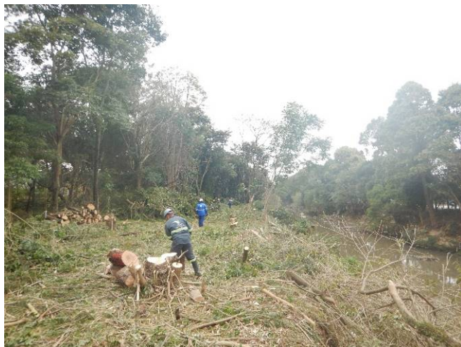
Foto 13: Área de supressão na porção sul da margem esquerda do rio Baquirivu Guaçu (Autorização nº 31890/2021).