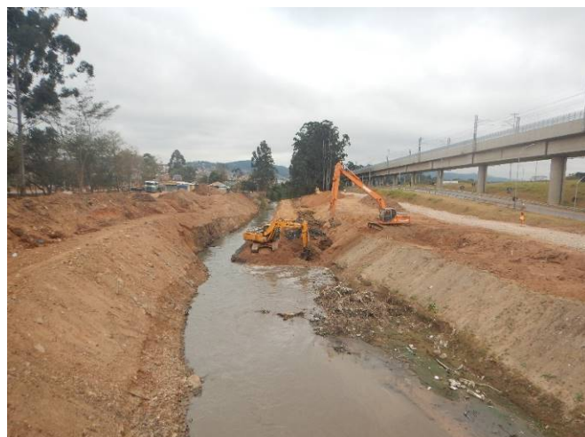
Foto 4: Instalação de ensecadeira - vista a jusante a partir da passagem aérea existente sobre o rio Baquirivu Guaçu, próxima à estação Aeroporto-Guarulhos.