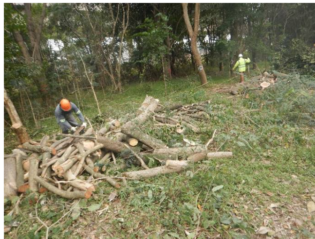
Foto 14: Separação do material lenhoso oriundo da supressão na porção sul da margem esquerda do rio Baquirivu Guaçu (Autorização nº 31890/2021).