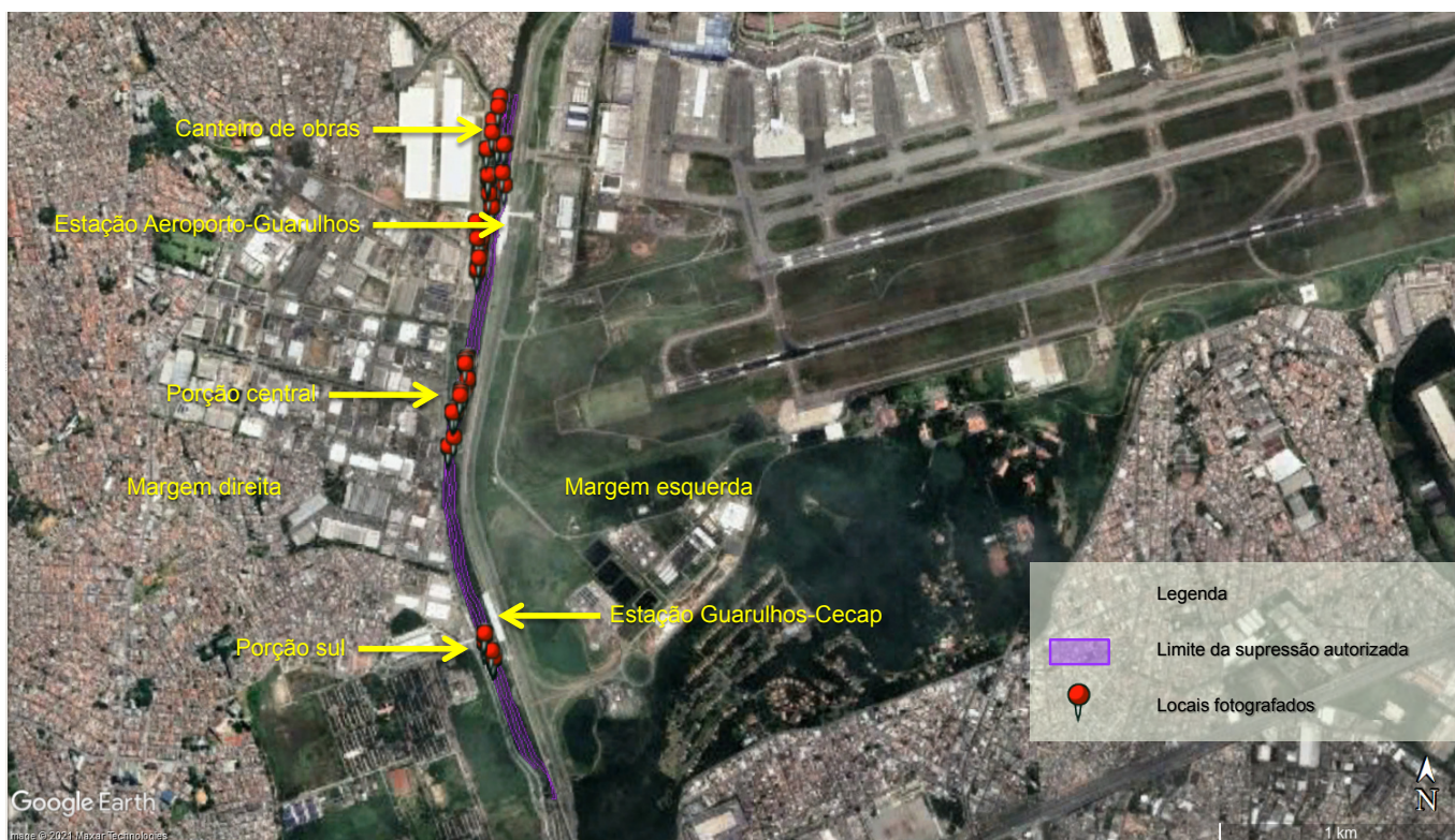
Figura 1: Imagem de satélite com identificação (pontos em vermelho) dos locais visitados nas áreas de implantação da 2ª etapa das obras de canalização do rio Baquirivu Guaçu (roxo).

A vistoria teve início na área de instalação do canteiro de obras, localizado na extremidade norte do trecho da canalização, entre a av. Natalia Zarif, o córrego Cachoeirinha e o rio Baquirivu Guaçu. O canteiro conta com estrutura para estoque de materiais, escritório, almoxarifado, refeitório, vestiários, etc. (fotos 1 e 2). As intervenções necessárias para implantação do canteiro de obras foram contempladas pela Autorização nº 38393/2021.