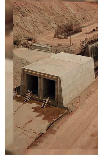
Galeria de desvio - Barragem Duas Pontes