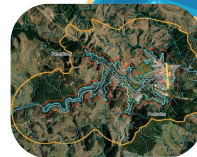
Mapa Pacuera Barragem Pedreira

Ainda na última etapa são incluídas apresentações e consultas a órgãos ambientais responsáveis, as prefeituras dos municípios e ao Comitê de Bacias do rio Piracicaba-Capivari-Jundiá (PCJ) também estão previstas a legitimação dos critérios adotados ao zoneamento da região para garantir sua viabilidade.