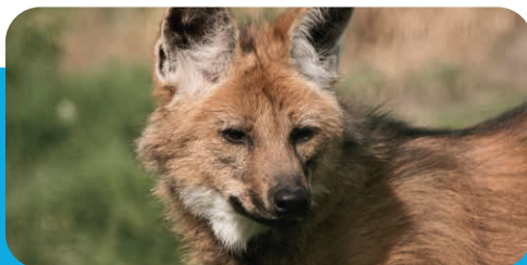
Lobo-guará ( Chrysocyon brachyurus ) registrado na área sob influência da Barragem Duas Pontes.