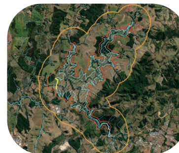
Mapa Pacuera Barragem Duas Pontes

A segunda etapa é relacionada ao ordenamento da área, que identifica, divide e analisa o território afetado. Ela contempla, ainda, a apresentação de programas ambientais considerados na instalação e operação do reservatório e que possuem relação com a área do PACUERA.